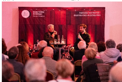
康特洛夫於普羅旺斯艾克斯音樂前分享