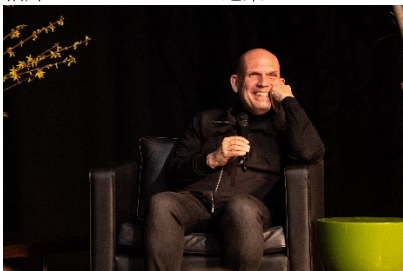
梵志登於鹿特丹音樂前分享